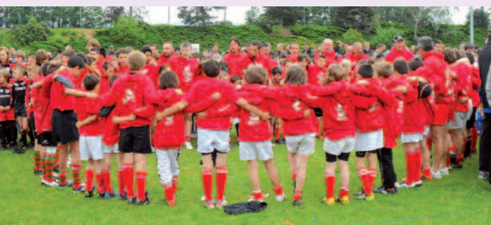
Une des photos à fait le « buzz » sur le web

L'équipe « première » présente une saison en demi-teinte et se positionne en milieu de classement à 4 matchs de la fin du championnat. N'hésitez pas à venir les encourager lors de leurs matchs à domicile. Les entraînements séniors sont le mercredi et le vendredi à 19 h 30. Nos équipes « jeunes », malgré un effectif restreint, sont en constante progression et ont remporté un grand nombre de leurs matchs. Si vous avez entre 15 et 17 ans et que vous souhaitez nous rejoindre vous serez les bienvenus aux horaires d'entraînements les mercredis et vendredi à 19 h au stade.