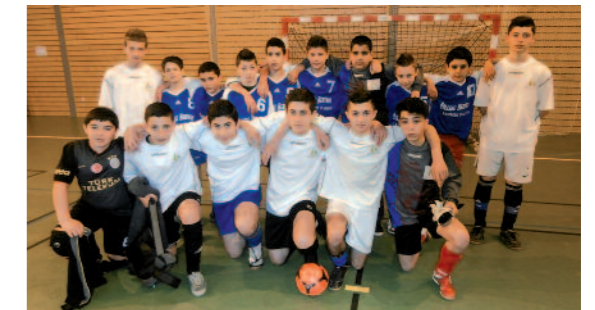
Nos équipes de Futsal : en bleu les benjamins qui ont fini cinquièmes, en blanc les minimes qui ont terminé premiers