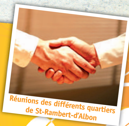
Réunions des différents quartiers de St-Rambert-d'Albon