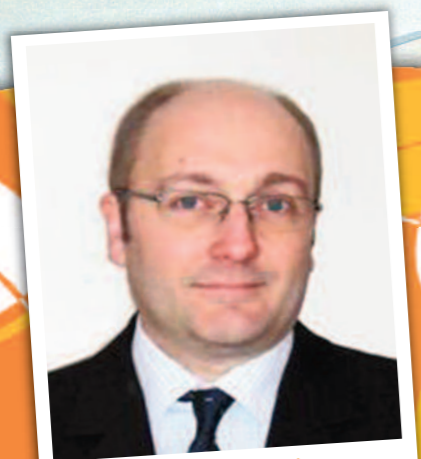
Nouveau Maire de St-Rambert-d'Albon